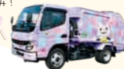
あじさいちゃんのパッカー車でおなじみ!

あしがら環境保全(株)では、お店などで回収できない「リチウムイオン電池内蔵製品」を持ち込んでいただいた場合、実費でお引き取りをしています。