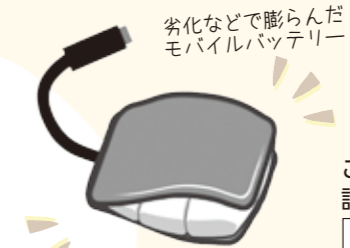
劣化などで膨らんだモバイルバッテリー