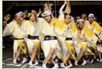
開成町役場周辺は毎年「開成町阿波おどりの」の会場として、熱気溢れる賑わいをみせます。