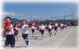
1年 キャラクター〜かがやけonly one〜

今年度は3学年合同の運動会を実施しました。前半が1・3・5年生（係活動を6年生）、後半が2・4・6年生（係活動を5年生）。自分たちで決めたスローガンどおりそれぞれが練習の成果を発揮し、自分の力を出し切り、さわやかで清々しい運動会になりました。競技以外にも5、6年生の応援団や係の活動も大変見事でした。みんなで造る運動会となったこともとても嬉しいです。ご家族の応援、力になりました。ありがとうございました。