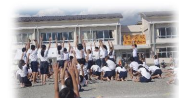
6年 Take Flight〜心をつに〜