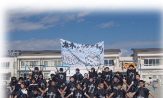
5年 ソーゴウ節〜米・モチ・池〜