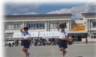
2年 シルクハットでシェー!!