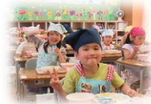
初めての給食！おいしかった！