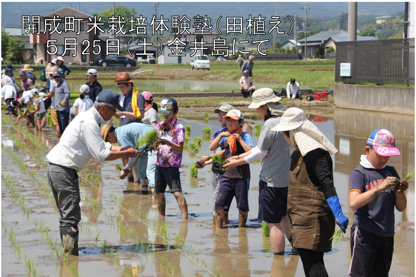
開成町米栽培体験塾（田植え） 5月25日（土）金井島にて