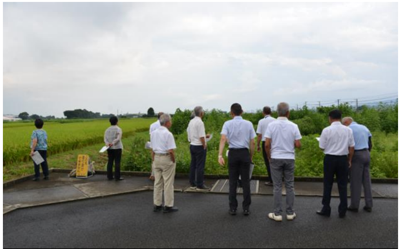
農業委員全員による一斉パトロール（令和元年8月）